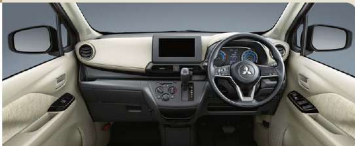
Photo:eKワゴン M 2WD ナビ取付パッケージ装着車 ボディカラー:オークブラウンメタリック(有料色:33,000円高/消費税抜価格:30,000円高) ●撮影のために点灯 ●インテリア写真はカットボディによる撮影