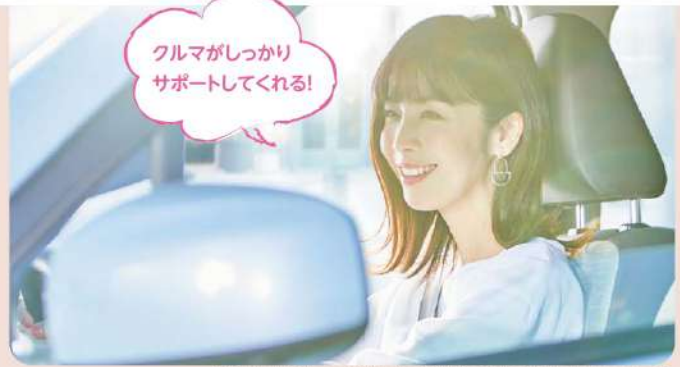
※写真はeKワゴン G 2WDのものを使用しております。写真はイメージです。

●衝突被害軽減ブレーキは、前方車両に対しては自車速が約10~80km/hのときに作動します。歩行者に対しては約10~60km/hのときに作動します。●停止保持機能がないため、停止後、約2秒でブレーキは解除されます。停止を続ける場合は、ブレーキペダルを踏んでください。●ハンドル操作やブレーキ操作による回避行動を行っているときは、作動しないまたは作動が遅れる場合があります。●FCMは、対象物、交通(急な割り込みなど)、天候(雨・雪など)、道路状況(連続するカーブなど)などの条件によっては正常に作動しない場合があります。●FCMは、前方車両と歩行者に対して作動します。二輪車などは作動対象ではありませんが、状況によって作動する場合があります。●FCMは、ドライバーの安全運転を前提としたシステムであり、運転操作の負担や衝突被害を軽減することを目的としています。システムの検知性能・制御性能には限界があるため、このシステムに頼った運転はせず、常に安全運転を心がけてください。●ご使用前に必ず取扱説明書をお読みください。