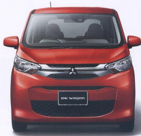
Photo:eKワゴン Joy Field-II 2WD ボディカラー:レッドメタリック ●その他のボディカラー(一部、有彩色がございます)、装備・諸元につきましては、ベース車となるeKワゴン カタログをご確認ください。●写真はイメージです。●価格は消費税込 ●保険料、税金(除く消費税)、登録などに伴う費用は別途申し受けます。●リサイクル料金が別途必要となります。●メーカーオプション選択時に価格が変更になります。●一部選択できないメーカーオプションがあります。*1 価格は本体価格に加え、取付工賃(1,320円)+消費税(10%)も含まれています。

令和4年3月登録! 2WDの車に ナビゲーションが付いて 総額130万円(税込) になります。 限定2台 お早めに♪ (ミントブルー・コーラルピンク)