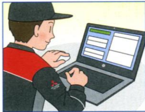
三菱自動車専用の 最新テスターで点検