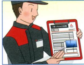
専用の診断書で各項目の結果を 分かりやすくご報告