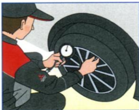
専門知識を持った サービスエンジニアが点検